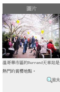
溫哥華市區的Burrard天車站是熱門的賞櫻地點。